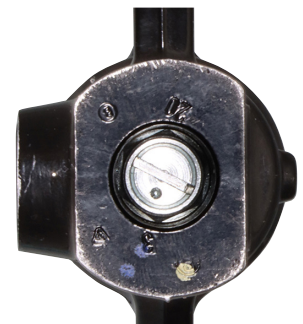
ボトムケース(左側)下面から見るイニシャルアジャスター ※アクスルシャフトは外しています。

本体はネジ部等強度重視のスチール製メッキ仕上げ!! イニシャル調整は⊖ドライバーで行い、一回転(正ネジ右回し)で1mm分のイニシャルが掛かっていきます。